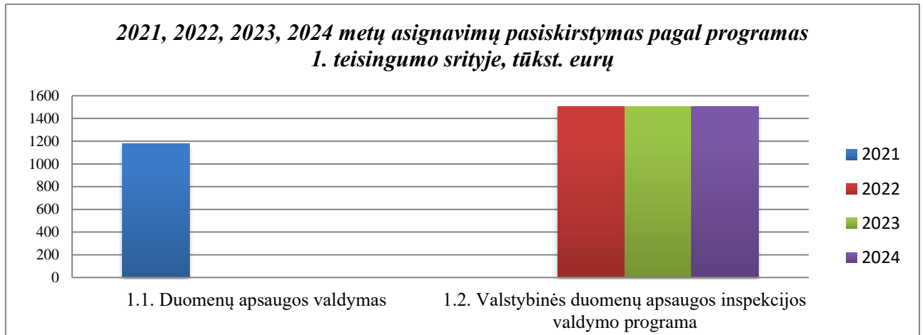
1 grafikas. 2021–2024 metų asignavimų pasiskirstymas pagal programas

1 teisingumo srities 1.1. programa Duomenų apsaugos valdymas ir 1.2. Valstybinės duomenų apsaugos inspekcijos valdymo programa